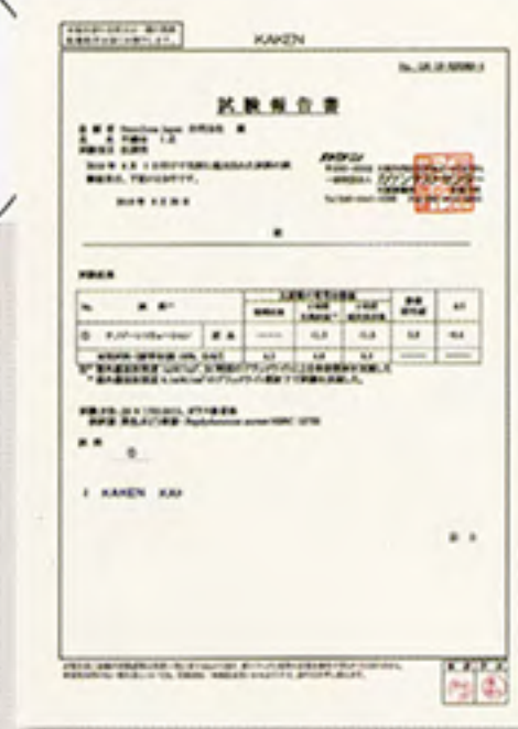
【資料】黄色ぶどう球菌の不活化試験 一般社団法人カケンテストセンター調べ